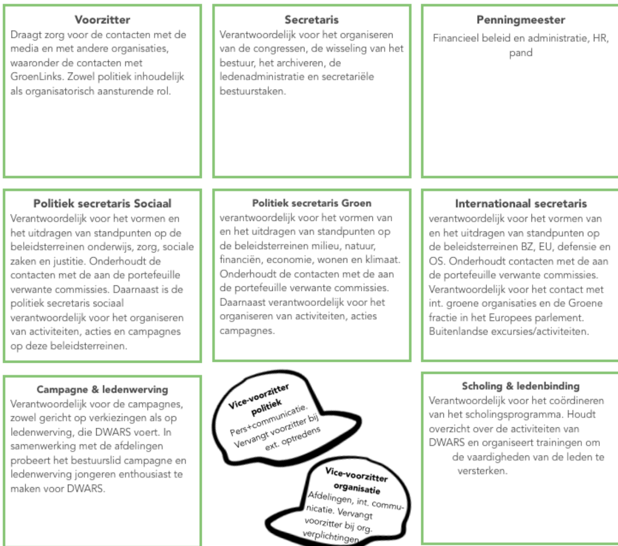
105 Schema 1: Huidige bestuursindeling

De V.O.C. is in de eerste plaats in het leven geroepen om de huidige indeling van de bestuursposten tegen het licht te houden. DWARS heeft op dit moment een bestuur met acht functies, waarvan twee dubbelfuncties (vicevoorzitters) (voor de precieze invulling zie schema 1). Het bestuur is het hoogste uitvoerende orgaan van de vereniging en primair verantwoordelijk voor de dagelijkse gang van zaken. Daarnaast is het de belangrijkste vertegenwoordiger van DWARS naar buiten toe. Controle en verkiezing van het bestuur vinden plaats op de twee keer per jaar daartoe bijeenroepen algemene ledenvergadering (verder: het congres). Daarnaast houdt de RvA toezicht op het functioneren van het bestuur. Het goed functioneren van het bestuur is gezien haar centrale rol binnen de vereniging van groot belang.